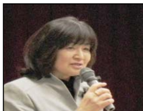
コープとうきょう小浦組合員理事の司会で進められました。

参加人数：57名（地域生協35名、全労済1名、日生協2名、中野区民10名、一般3名、中野区3名、東京都生協連3名）