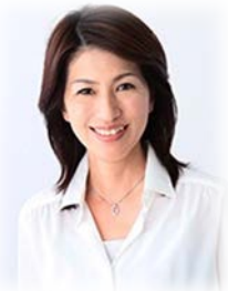
《講師プロフィール》

講演を受けて、自分の仕事や生活を振り返り、これからどのようにしていきたいのか、そのためには何が 필요한のか、話し合ってみましょう♪