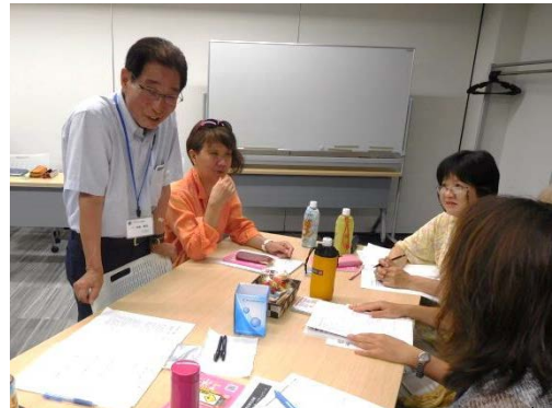
グループに入り、いろいろアドバイス「なるほどなるほど」と感心

大人用の紙おむつの吸収力はすごいので、用意しておくといいよ。小銭も持っていないと大変！私は、2000円を小銭で家族の人数分を常に用意しておいてあるよ。