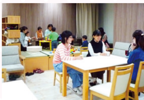
テーブルスペース