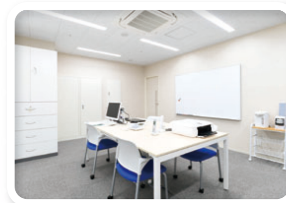
訪問看護ステーション

訪問看護ステーション、介護センターが新たに設置され、5～9階のグループホーム・サービス付き高齢者向け住宅と連携して皆様の快適な生活へのお手伝いをします。