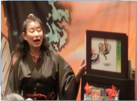
昔懐かしい『黄金バット』の口演も！

「詐欺被害撲滅紙芝居シリーズ」の口演やとんちクイズで、楽しく笑いながら消費者被害にあわないためにはどうしたらいいかを学びました。騙されないように家族で“愛言葉！”を決めておくことや、困ったことがあったら身近な人に相談することを心がけることが大切だということがわかりました。