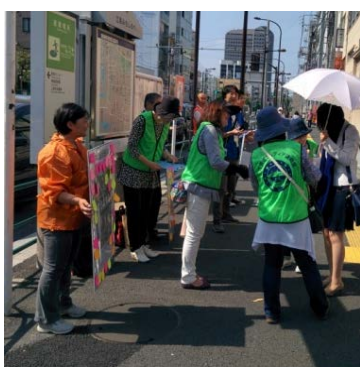
東京メトロ東陽町駅前