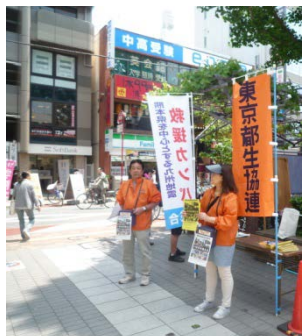
烏山区民センター前

■暑い日でしたが、オレンジジャンパーを着た会員のみなさんが大活躍でした。エールが届くことを願って大きな声で、街のみなさんに呼び掛けました。