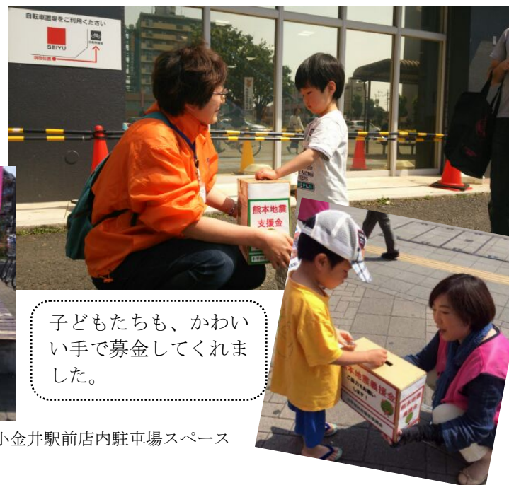
西友小平駅前店散歩道

■暑い日でしたが、オレンジジャンパーを着た会員のみなさんが大活躍でした。エールが届くことを願って大きな声で、街のみなさんに呼び掛けました。