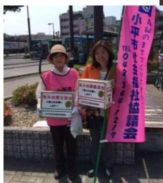
いなげや花小金井駅前店内駐車場スペース

■医療生協、地域生協、社会福祉協議会など様々な団体がつながって活動ができました。思いはいつもひとつ。