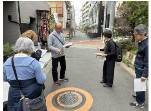
やっと見つけた消火栓！