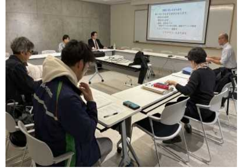
まち歩きのポイントを説明して出発！