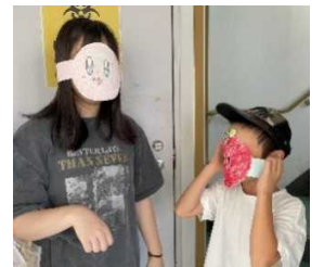
好きなキャラクターでお面作り お姉ちゃんと来ました