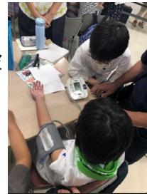
血圧測定や聴診器もチャレンジ 学んだことは壁新聞に!