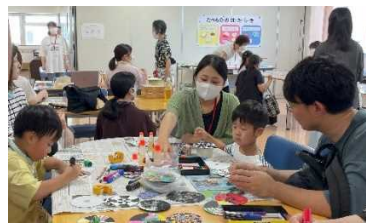
CDでつくるコマ 絵を描いてビー玉をはめ込んで完成