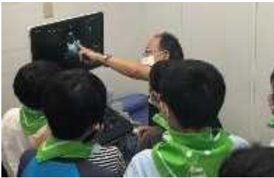
超音波では血液の流れもわかります