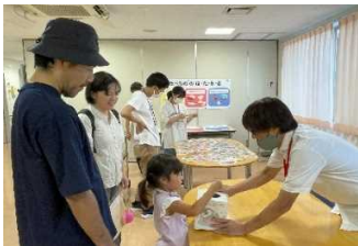
東都生協のゼリーつかみ 同じ色が出たらもう一つプレゼント!