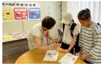
子ども健康チャレンジコーナー 栄養バランスの良い献立を考えよう