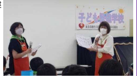
コープみらいのブロック委員さんによるクイズタイム

探検のあとはコープ商品のおやつタイム、栄養のお話、クイズタイム、壁新聞づくりなど、盛りだくさんの内容でした。親子で楽しく学べる一日に、みなさん大満足の様子でした。